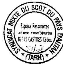
Schéma de cohérence territoriale du Pays d'Autan Elaboration du PADD