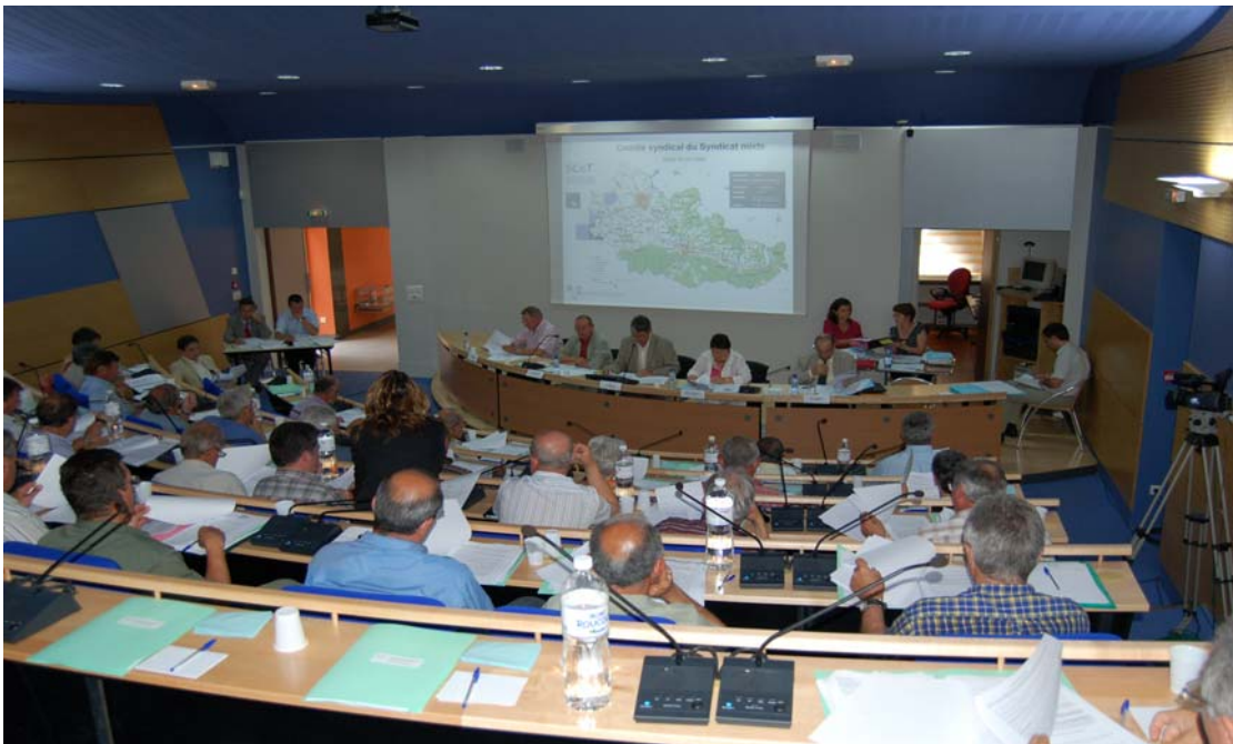
Réunion du Comité syndical : engagement de la procédure – extrait de « pôles sud , magazine de l'agglomération de Castres-Mazamet - juillet 2006