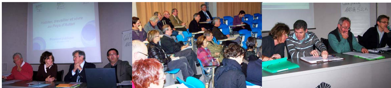
Réunion publique du 1 décembre 2009

C'est avec le Pays qui a souhaité organiser les assises du développement durable, que s'est tenue une réunion publique sur le SCoT, le 1 décembre 2009, à la chambre de commerce et d'industrie du Tarn à Castres. Un communiqué de presse a été envoyé aux journaux locaux et plus de 300 invitations ont été envoyées.