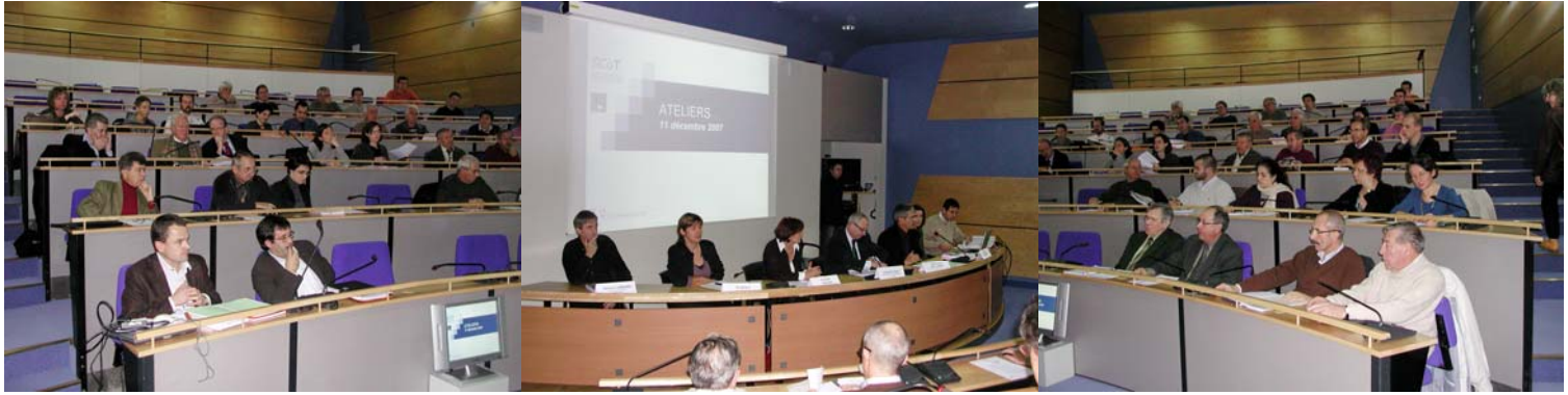
Les ateliers du 11 décembre 2007